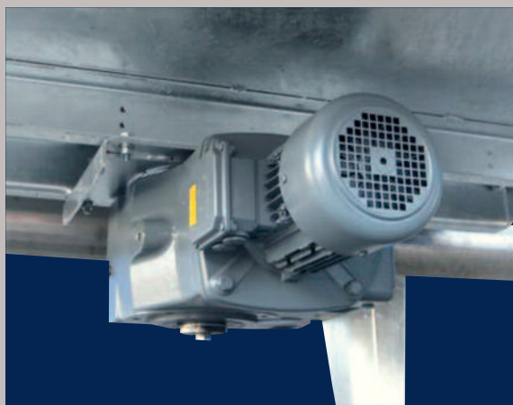
Alle aandrijfmotoren hebben een gesloten tandwielkast