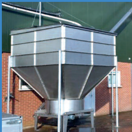
De CCM doseerder is volledig vervaardigd uit hoogwaardig rvs

De CCM-doseerder is volledig vervaardigd uit hoogwaardig rvs. Door de modulaire opbouw is de standaarduitvoering (inhoud 3,7 m 3 ) uit te bouwen tot 8,2 m 3 . Daarnaast hebben we de 'Jumbo'-uitvoering. Deze heeft standaard een inhoud van 5,8 m 3 en is uit te bouwen tot 14 m 3 . Door de modulaire opbouw is het te allen tijde mogelijk de inhoud te vergroten.