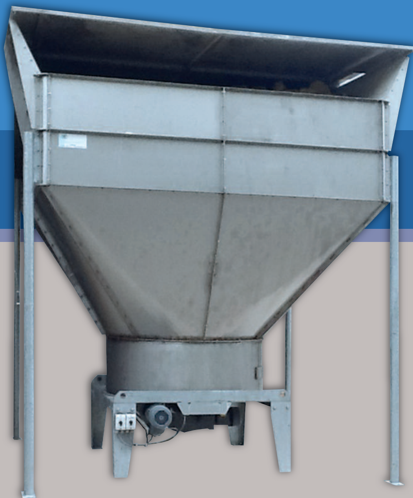
De CCM doseerder heeft een modulaire opbouw