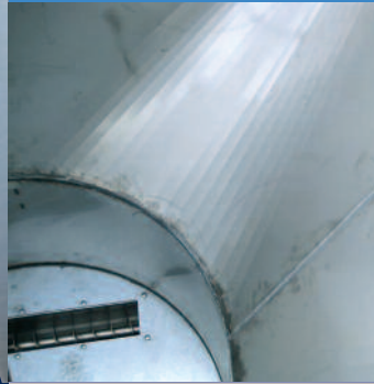
Trogvijzel met halfronde deksel